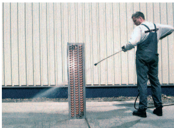
Konventionelle Reinigung des Wärmeübertragers mit Hochdruck

Es besteht aus einer kombinierten Druckluft- und Dampfreinigung mit Absaugung und ermöglicht Ihnen eine schnelle gründliche Reinigung und Desinfektion der Wärmeübertrager.