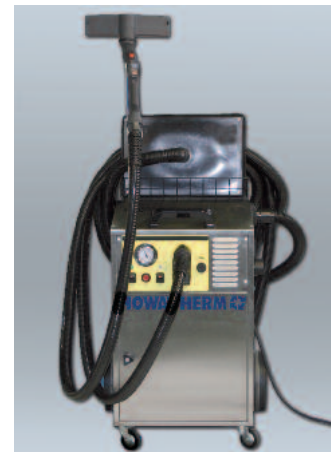
Platzsparende Aufbewahrung – jederzeit einsetzbar