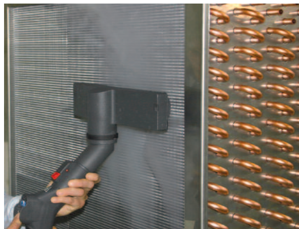
Breite Düse für schnelles und gründliches Dampfreinigen